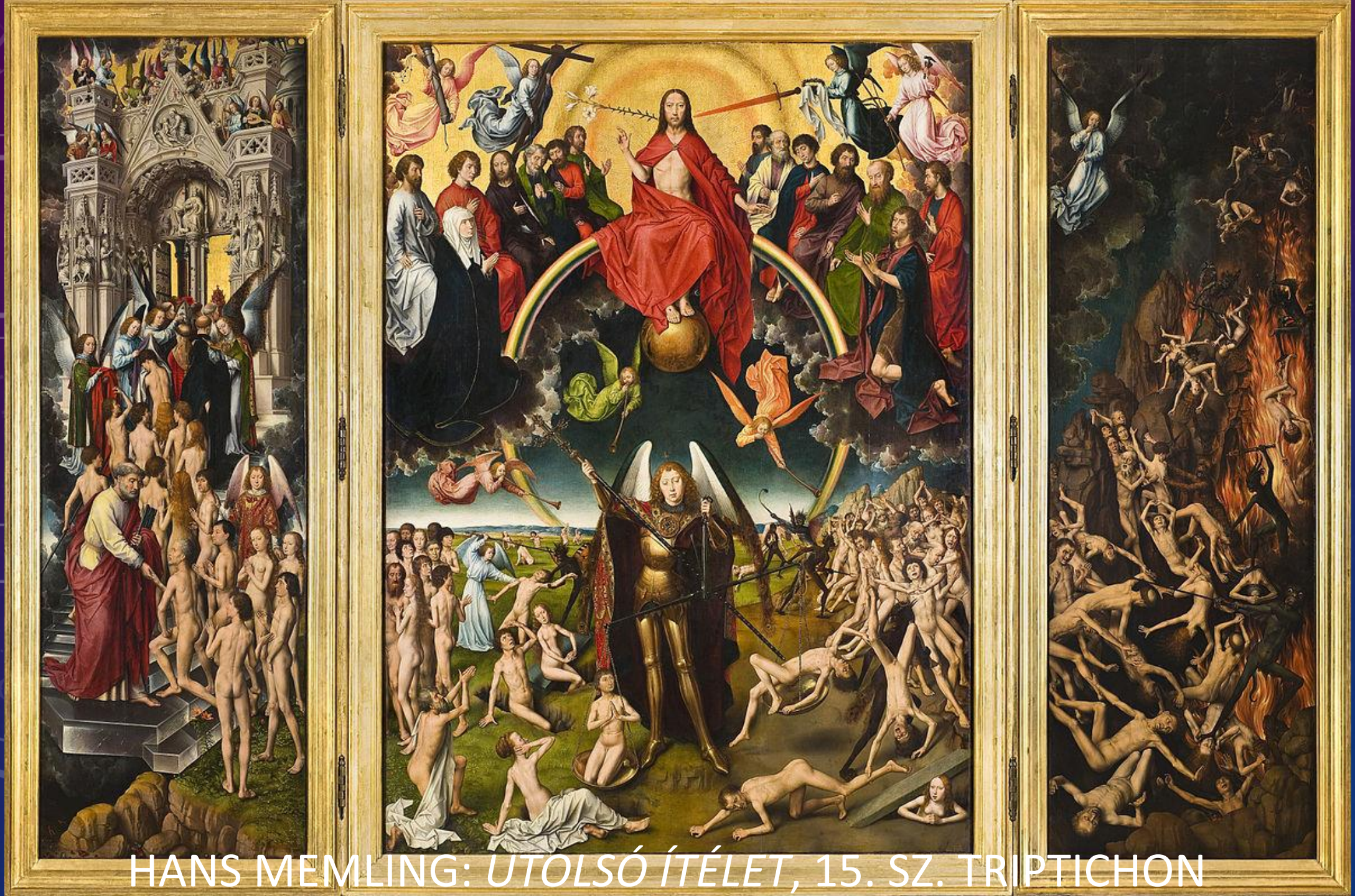
HANS MEMLING: UTOLSÓ ÍTÉLET , 15. SZ. TRIPTICHON